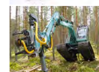
Der Kesla Xtender ist im unwegsamem Gelände eine zusätzliche Hilfe.