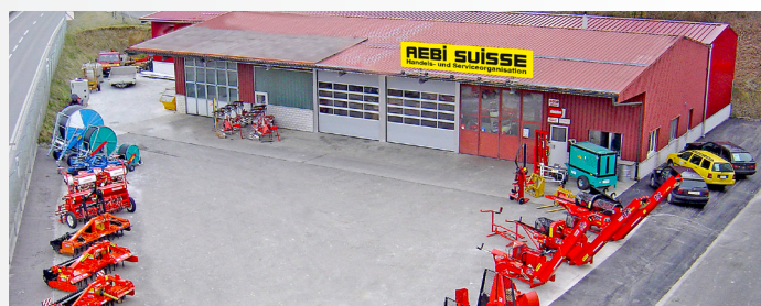
ANDELFINGEN , Im Bilg 14, Tel: 032 312 70 30