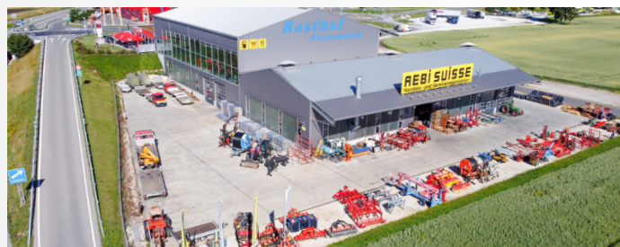
GAMPELEN , Platenenstrasse 1, Tel: 032 312 70 30